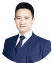
智库研究部首席分析师 - 启明