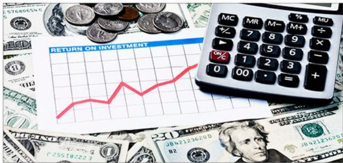
图示：美联储正式启动 Taper

这就提升了美联储在未来猛踩货币政策刹车的概率。部分美联储官员表示，通胀保持在高水平会成为提早加息的理由。美联储理事勒沃表示，如果在今年剩余时间内，每月的通胀数据居高不下，美联储可能会采取更“鹰派”的货币政策。所以高通胀倒逼美联储加快收紧步伐是很可能的。