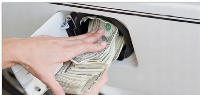
图示：油价持续上涨

就是没有从历史中吸取到任何教训”。随着油价的持续上涨，各大投行对油价的预期正在发生改变。