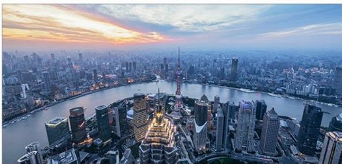
图示：共同富裕下消费亦升级

欧盟、英国和加拿大等32个国家，在12月起取消给予中国「普惠制」的贸易优惠待遇。所谓「普惠制」待遇，全名为「普遍优惠制度」（GSP），乃是指发达国家对原产于发展中国家的出口制成品、半制成品，给予普遍而非互惠的关税优惠制度。