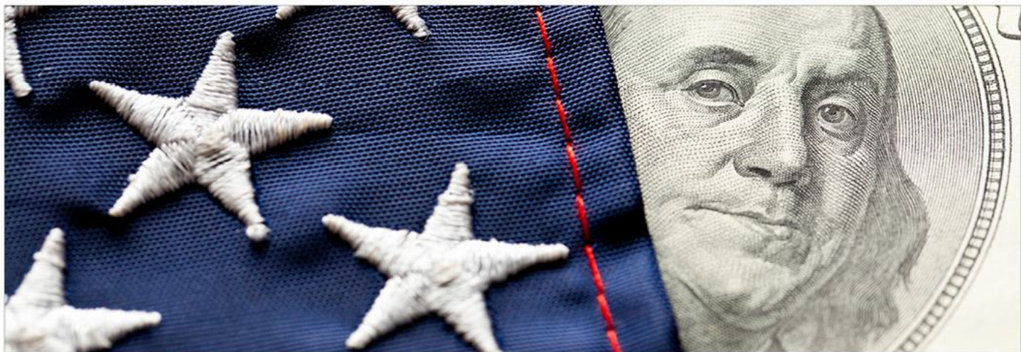
图示：美国经济增长明显放缓