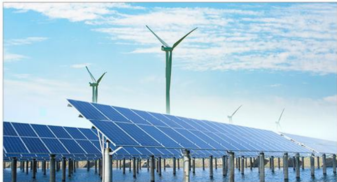
图示：新能源板块持续上涨

今年以来，新能源板块继续领涨两市，特别是锂电池板块表现突出，包括上游的钴、锂资源股，中游的锂电池产业链以及下游的整车，都是新能源汽车发展最受益的一些方向。