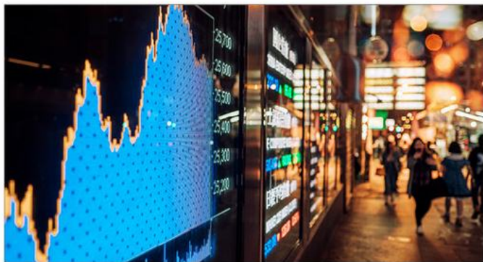
图示：内银股现佳绩