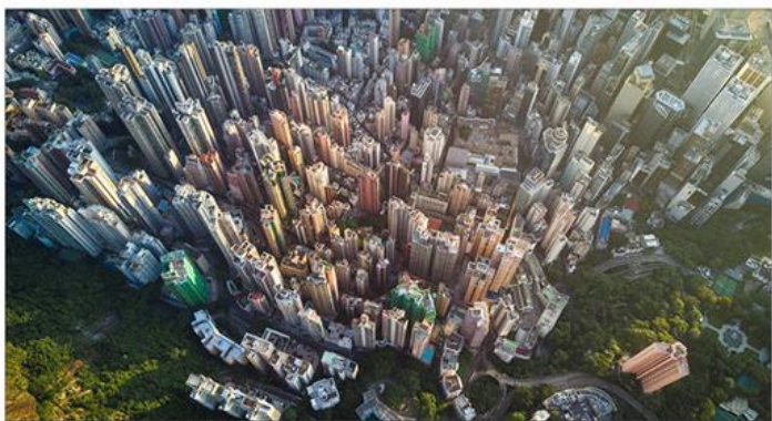
图示：部分地区开展房地产税改革工作

环，即通过土地抵押、取得融资、投入基建、改善城市面貌，从而促使地价上涨、更容易实现土地抵押融资，整个过程中地产和金融紧密相连。无论是土地财政还是土地抵押融资，都是在增量上做文章。然而，这种模式近年逐渐出现颓势，难以为继。随着不少城市人口在流出，城市扩张的空间已经有限，导致不少地方政府正在丧失土地继续增值和招商引资的优势。因此，寻找新的税源，从增量税改成存量税，似乎已是必然。